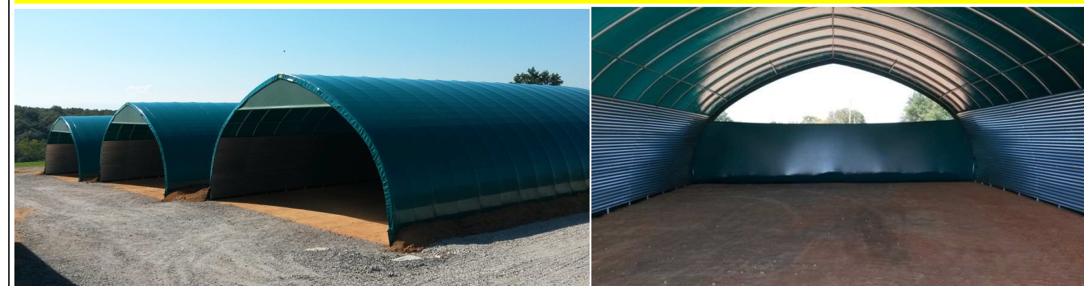
DEMI-LUNES BRISE VENT