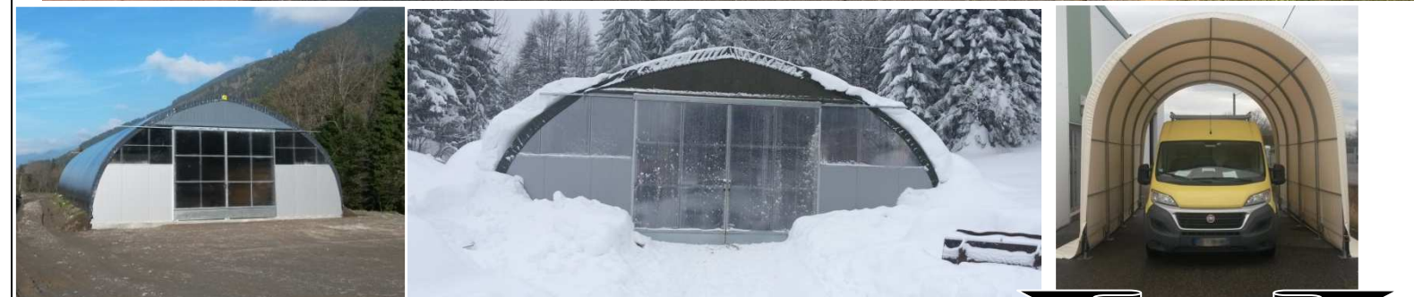
PIGNONS ISOLÉS AVEC PORTAIL 3x4m