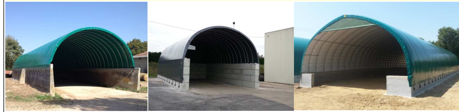
TUNNEL BASES BÉTON